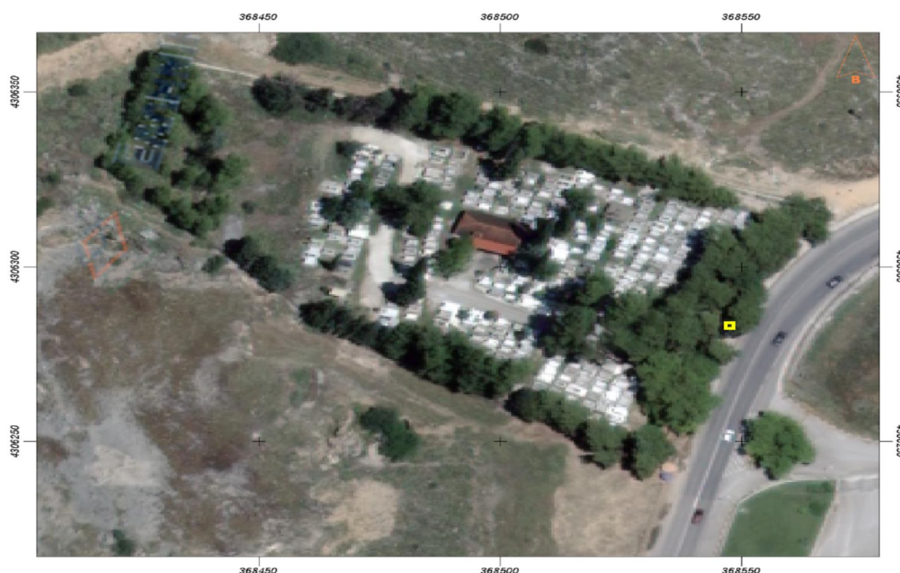
Εικόνα 1: Θέση πεύκων στον εξωτερικό χώρο του Κοιμητηρίου ( με κίτρινο χρώμα)

Κατά την αυτοψία που διενεργήθηκε, διαπιστώθηκε ότι εντός και εκτός του κοιμητηρίου φύονται πέντε (5) δέντρα , ήτοι τρία πεύκα και δύο πλάτανοι , για τα οποία θα πρέπει να ληφθούν μέτρα για την άρση της επικινδυνότητάς τους.