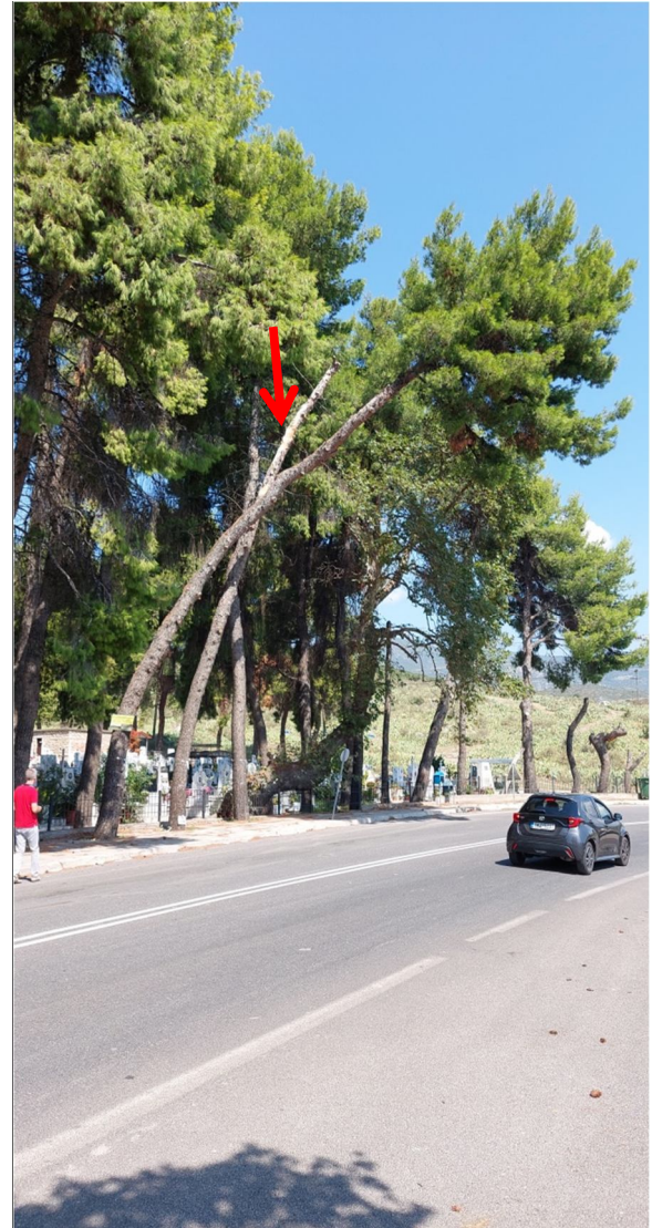
Εικόνα 2: Θέση πεύκου ( με κόκκινο χρώμα) Εικόνα 3: Θέση ξερού πεύκου ( με κόκκινο χρώμα)

Επίσης, εκτός του κοιμητηρίου παρατηρήθηκαν δύο πλάτανοι, εκ των οποίων ο ένας έχει στρεβλό κορμό, και έχει πάρει μεγάλη κλίση ως προς την κατακόρυφο, με κατεύθυνση προς την ΠΕΟ Λαμίας-Βόλου.