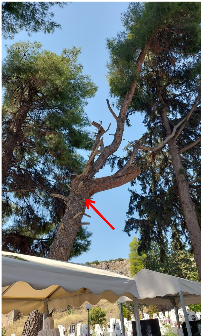
Εικόνα 5: Θέση πεύκου εντός κοιμητηρίου ( με κόκκινο χρώμα)

Εντός του κοιμητηρίου, παρατηρήθηκε πεύκο μέσης ηλικίας και ύψους περίπου 15 μέτρων, το οποίο έχει πάρει σχετικά έντονη κλίση ως προς την κατακόρυφο, με αποτέλεσμα να εγκυμονούν κίνδυνοι ασφάλειας για ανθρώπους.