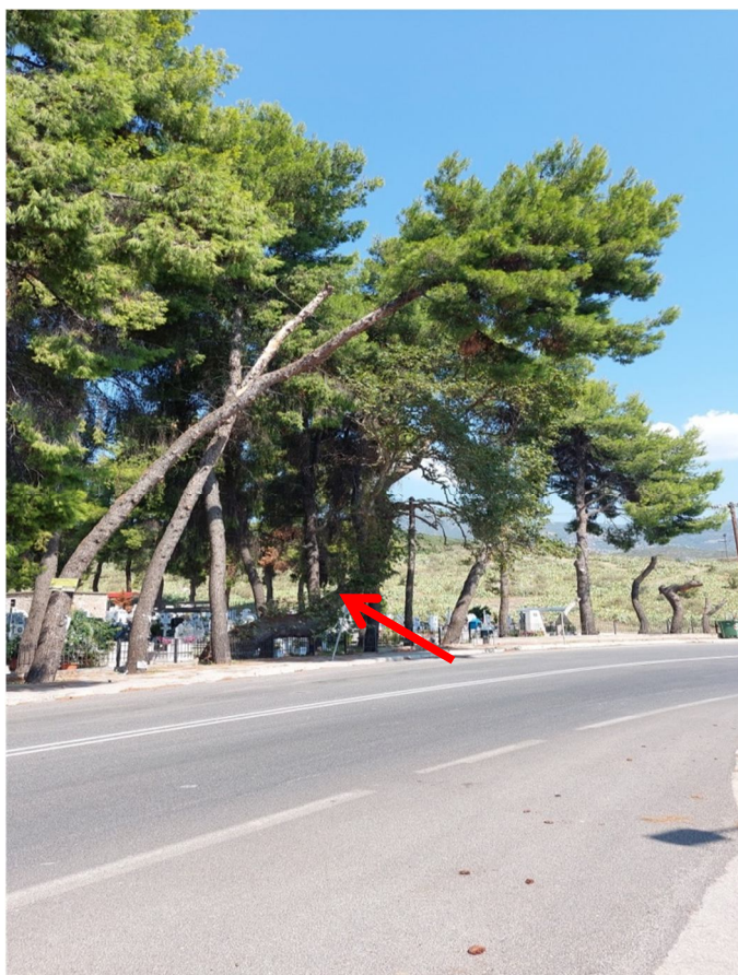
Εικόνα 4: Θέση πλάτανου με στρεβλό κορμό( με κόκκινο χρώμα)